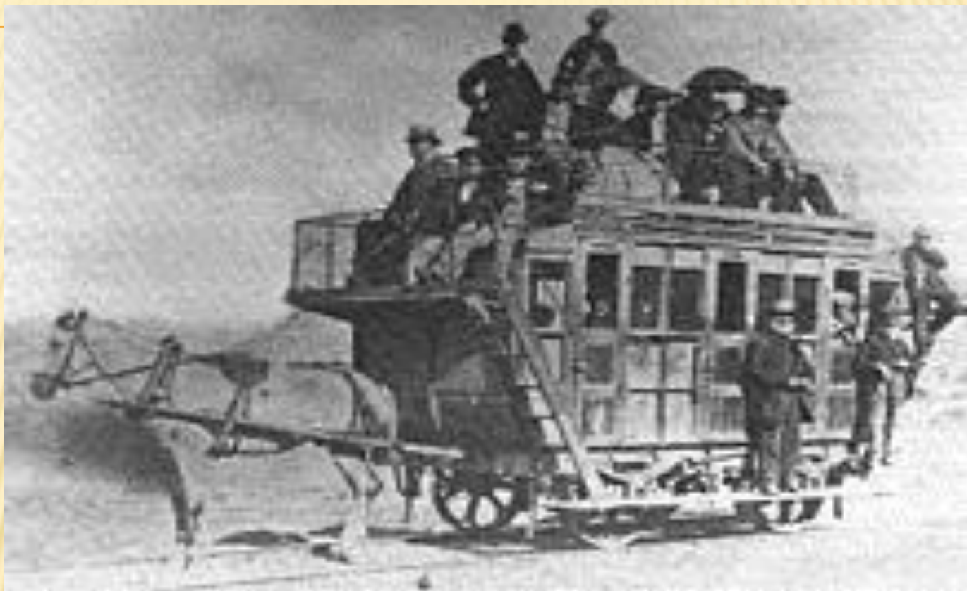
Конка с пассажирами на крыше и подножках, 1870 год