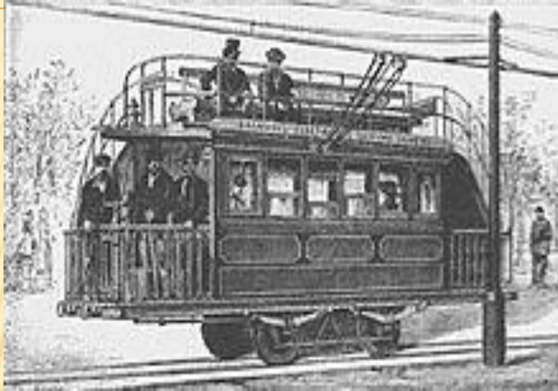
Один из первых электрических трамваев Парижа с пассажирами на крыше, 1881 год