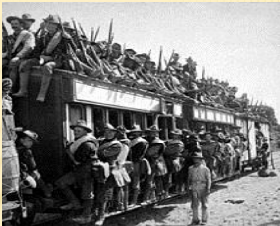
Солдаты во время следования на фронт, 1900 год