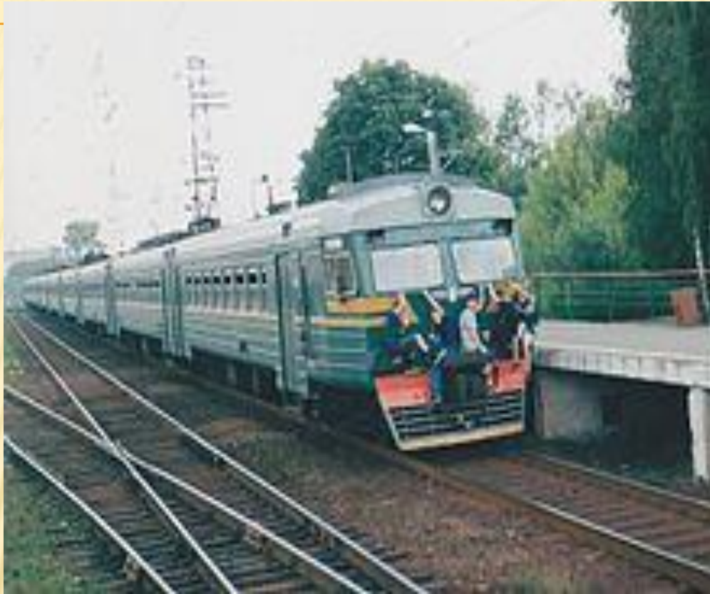
Подростки на хвостовой кабине электropоезда ЭД4 в 2002 году (Россия)